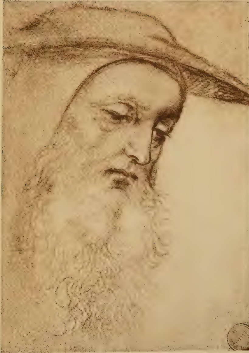
Dessin pour la tête de Saint Jérôme